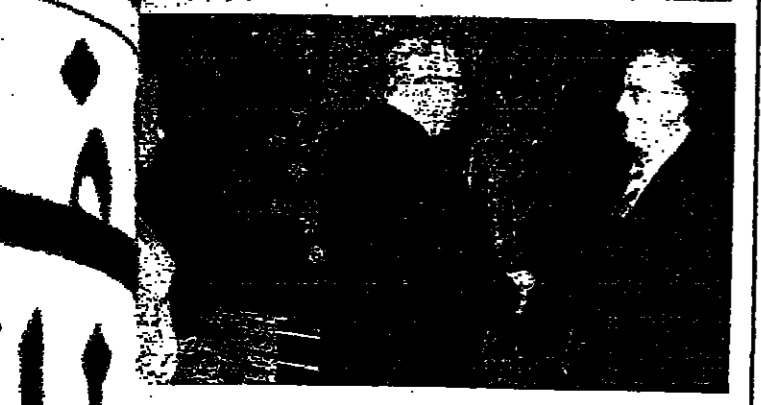
اتام السفير السوفياتي في بيروت الكسندر سولوتوف مساء ١٠ حفلة استقبال بمناسبة الذكرى الثلاثين للانتصار على الفاشية حضر والوفاء والشخصيات - وفي الصورة يندو السفير يريخ بوزير غيب تولا (صورة من ذاتي ونهرا)